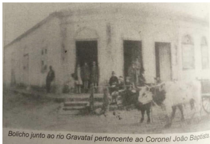
Figura 2: Armazém dos Wilkens e Ponte do Rio Gravataí