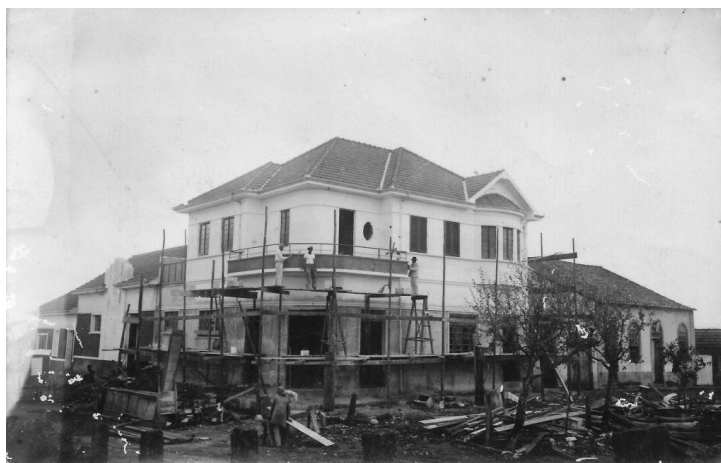
Figura 1: Casa de João construiu próxima ao rio Gravataí

Souza, o comendador 3 , as terras onde iniciava o rio Gravataí que se estende até onde hoje é a Morada do Vale, onde seria o limite do município de Gravataí. No ano de 1917 sua filha e seu genro, Carlos e Olívia, foram morar na residência que João havia construído próximo ao rio Gravataí. Com os anos se passando a família deles aumentou e fizeram uma reforma na residência para conter sete quartos para seus filhos e hóspedes.