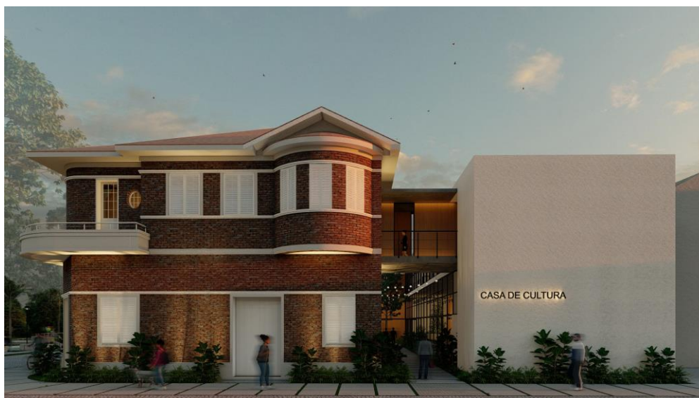
Figura 5: Fachada do projeto do Troyano Arquitetura