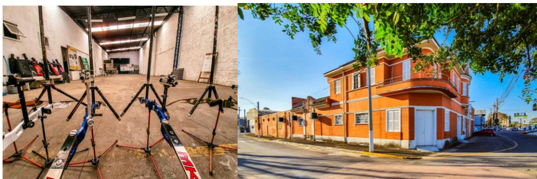
Figura 4: Aulas de arco flecha e fechada da Casa de Cultura

No ano de 2021 o CAU/RS abriu vagas para selecionar projetos arquitetônicos para espaços de referência da história e cultura de cinco cidades gaúchas, o Iconicidades. “As propostas para intervenção em espaços considerados simbólicos, seja pelo caráter histórico, localização ou potencial de atrair público serão nas cidades de Cachoeirinha, Pelotas, Rio Grande, Santa Maria e São Leopoldo, com um edital por cidade” (CAU/RS;2021). Em 2022 o Concurso Público Nacional de Projetos de Arquitetura e Urbanismo Iconicidades apresentou o concurso para melhorias e reformas na Casa de Cultura Demóstenes Gonzalez, da Avenida Beira Rio e Avenida Flores da Cunha, ruas em que se encontra a casa, patrimônio público de Cachoeirinha, com a reforma feita acredita-se que isso irá estimular a sociedade a frequentar mais o espaço da casa de cultura que hoje oferece diversos tipos de aulas para comunidade de forma gratuita.