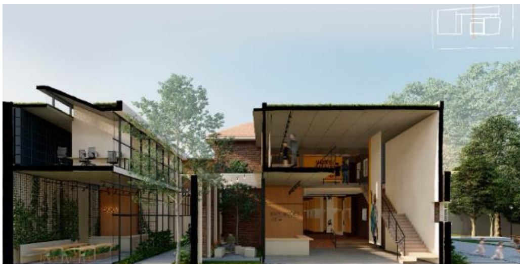
Figura 6: Fachada do projeto do Troyano Arquitetura